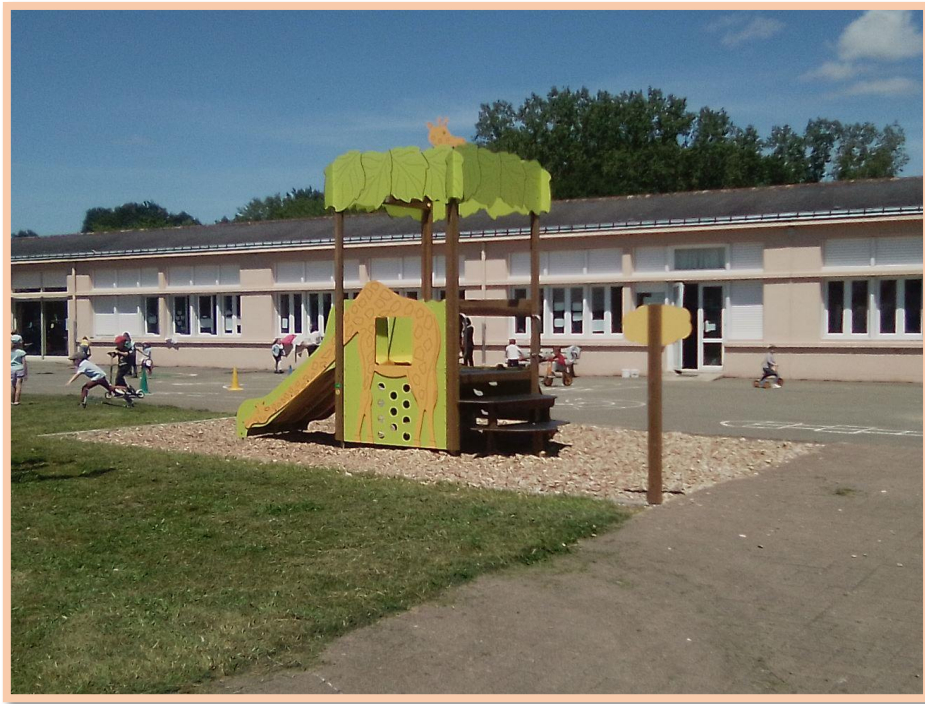
École publique maternelle et primaire « Pomme de Reinette »